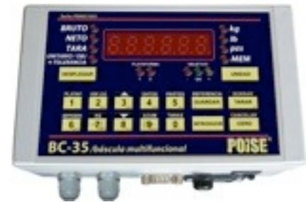
Indicador POISE® BC-35