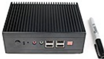
Computadora Industrial de estado sólido