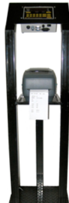
Stand para indicador e impresora