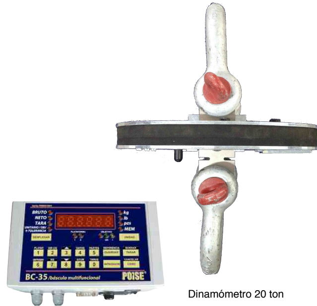
Dinamómetro 20 ton

La celda de carga resiste fuerzas de doblez y pares torcionales. El indicador POISE BC-35 le da al dinamómetro las funciones de impresión de etiquetas, registro de datos, retransmisión de peso por red, a pizarrón electrónico o a terminal manual entre otras. Diseño de gabinete que protege a la celda de carga y tarjeta electrónica contra los golpes y maltratos que se dan comúnmente en las grúas viajeras.